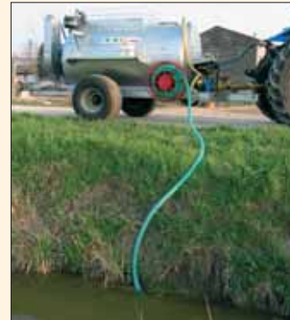
Pompa di caricamento anti-polluzione 250 l/min e Rullo avvolgitubo. Pompe de remplissage anti-pollution, débit 250 l/min. avec enrouleur.