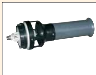
Super-Agitazione con Dual Mixer. Super-Brassage par Dual Mixer.