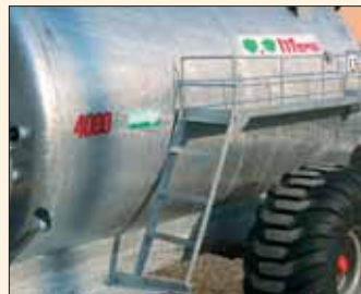
Scaletta per accesso al porta-accessori. Échelle accès au porte-accessoires.