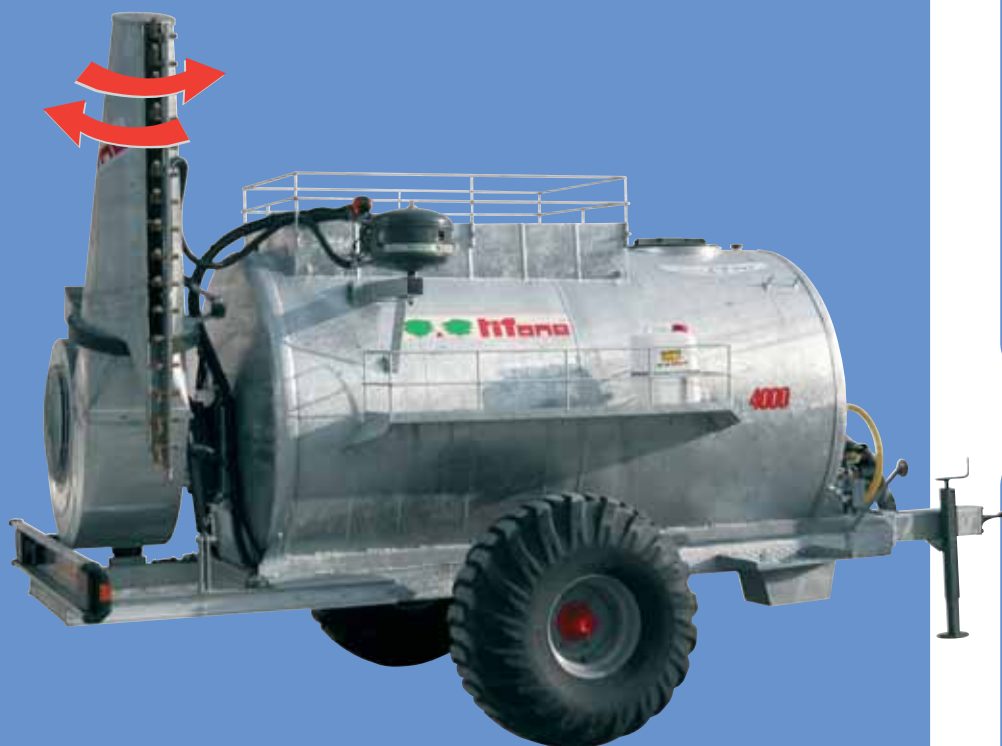
TIFON-CAR PUNTERUOLO PENNELLANTE AUTOMATICO TÊTE PUNTERUOLO VA-ET-VIENT AUTOMATIQUE