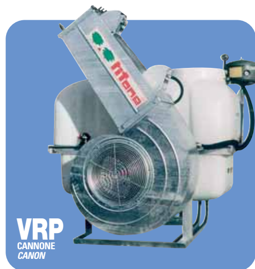
VRP CANNONE CANON