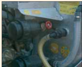
Serbatoio lavacircuito integrato. Réservoir rince-circuit intégré.