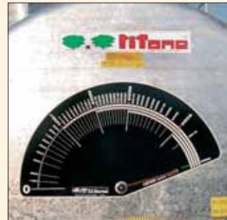
Grande livello meccanico. Indicateur niveau en cuve.