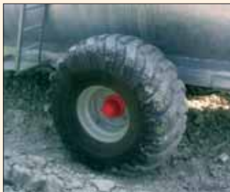
Ruote extra-large per ogni terreno. Roues extralarges tout-terrain.