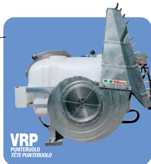
VRP PUNTERUOLO TÊTE PUNTERUOLO