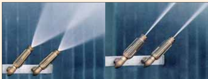
Ugelli a getto regolabile Buses à gerbe réglable.