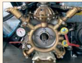
Superpompe da 140 a 220 l/min. in bronzo con filtri autopulenti. Pressione regolabile fino a 50 bar. Superpompes de 140 à 220 l/min, 50 bar, en bronze, avec filtres autonettoyants.