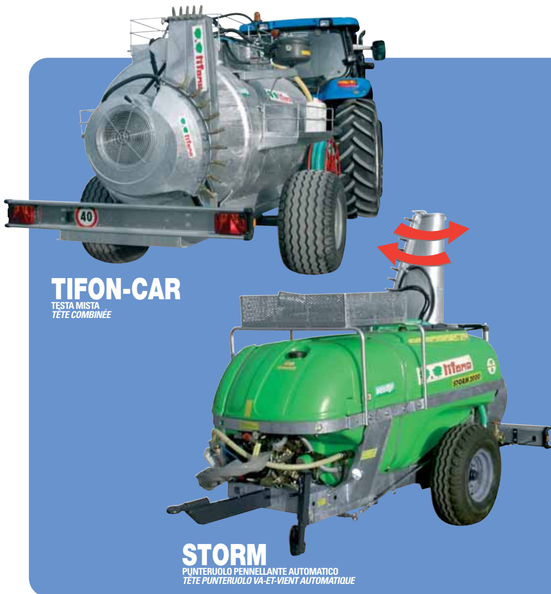
TIFON-CAR TESTA MISTA TÊTE COMBINÉE