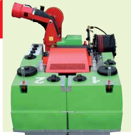
2 serbatoi separati

Il "Dual", disponibile in varie motorizzazioni con motori di ultima generazione leggeri e silenziosi, è ideale per ogni tipo di trattamento disinfestante, il suo potente cannone Flexigun originale Tifone assicura gittate sino a 30 metri.