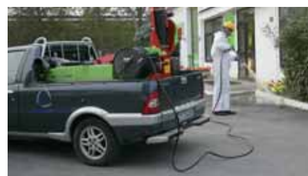
Massima flessibilità operativa